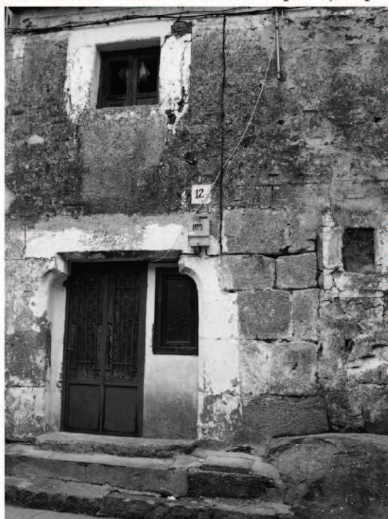
Figura 2. Construcción tardogótica localizada en la judería de San Felices de los Gallegos.

El tema de la cruz grabada en la pared al otro lado de las fronteras castellano-leonesas, viene siendo objeto de frecuentes análisis como los llevados a cabo por Antonio Saraiva y Carmen Balesteros para el caso de la ciudad de Guarda (SARAIVA Y BALESTEROS, 2007) y de las más importantes juderías de las Beiras 1 ,