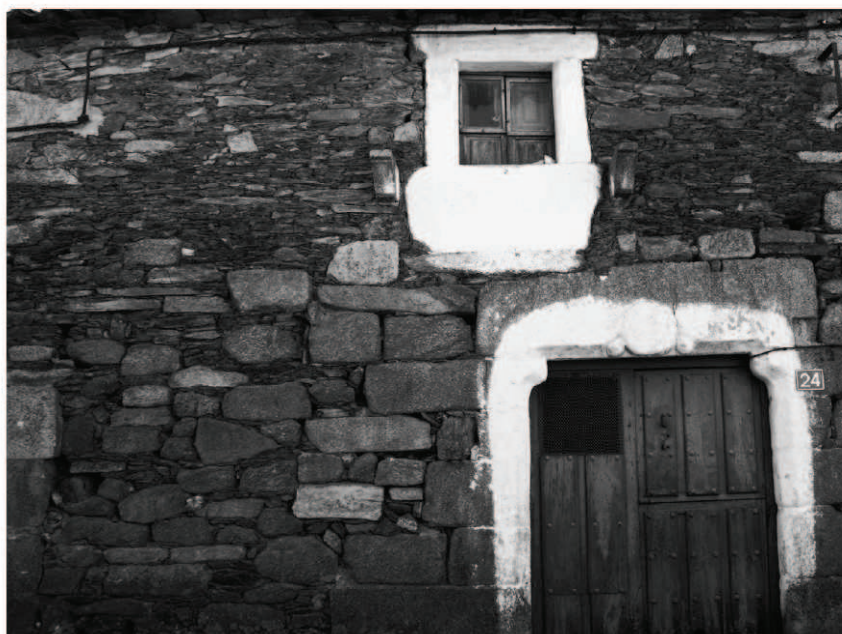
Figura 1. Construcción característica del siglo XVI de la localidad ribereña de Vilvestre.

La cruz se nos presenta tanto en la arquitectura religiosa donde, por lo general, comparece en ciertas partes del edificio – lado de la epístola, remates y veletas, portadas o campanas según marca la norma litúrgica (AZCÁRATE, 1932:46-48; CABROL Y LECLERQ, 1913 [III]: 3046-3143) –, como en la doméstica. A la hora de estudiar la cruz en el contexto edilicio asistimos a un evidente fenómeno de transposición de las construcciones religiosas a las civiles/domésticas; ello nos va a permitir definir en unas y otras sus características y, por extensión, toda una serie de cuestiones relativas a su cronología, motivaciones, localizaciones e incluso a fenómenos específicos de visibilidad/invisibilidad, de acumulación e incluso de sustitución de unas por otras a lo largo del tiempo. El análisis de la cruz en la arquitectura religiosa y doméstica traduce de forma patente una continua transferencia (religiosa a doméstica a través de influencias estilísticas o litúrgicas), pero que también muestra un camino de retorno, a través de la interferencia de lo popular en lo culto (religiosidad popular a oficial) por medio de determinadas manifestaciones religiosas espontáneas.