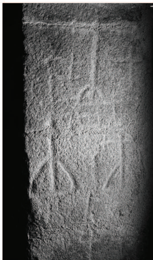
Figura 6. Cruces grabadas en el umbral de una construcción de Hinojosa de Duero.