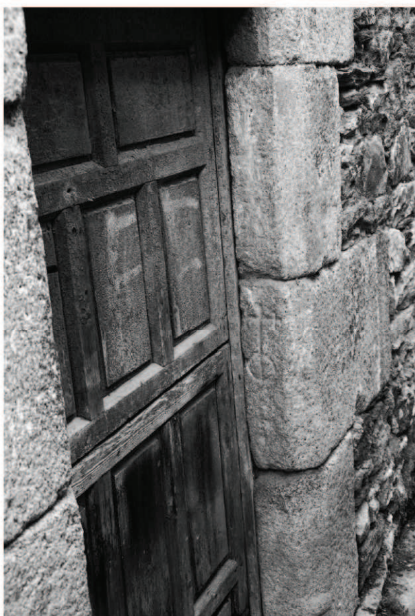
Figura 5. Cruz grabada de conversos en una construcción de Hinojosa de Duero.

Finalmente, la característica principal que parece definir esta familia de cruces es el de su tipología, ya que en la arquitectura de este momento los que se encuentran presentes de forma recurrente son las cruces de pie semi-circular, las cruces sobre orbe y, en menor medida, las cruces sobre pie triangular. En todos los casos uno de los rasgos que mejor las definen es el ensanchamiento de sus extremos o la presencia de trazos secantes en el remate